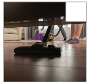
Boden staubsaugen und wischen. Nicht unter dem Bett vergessen.