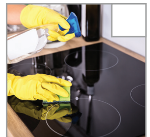
Herdplatte wird gereinigt.