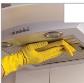
Dunstabzugshaube wird mit einem feuchten Tuch gereinigt; wenn sie ausziehbar ist, ziehen Sie sie vollständig heraus.