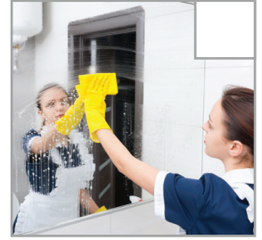
Spiegel werden mit Fensterreiniger gereinigt.