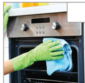
Ofen und Mikrowelle werden innen und außen gereinigt.