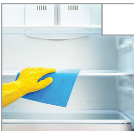
Kühlschrank wird geleert und gereinigt.