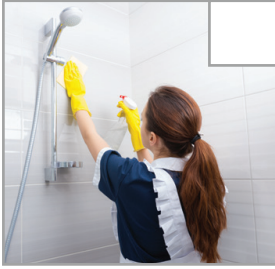
Wasserhahn wird gereinigt.