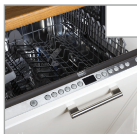
Leeren Sie den Geschirrspüler.