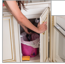
Müllbeutel entfernen und Schrankinnenseite abwischen.