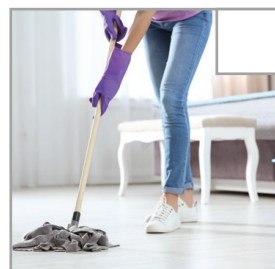
Alle waschbaren Böden werden gewischt.