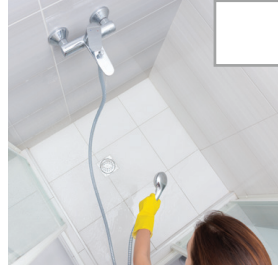
Duschnische wird gereinigt, Haare und anderer Schmutz aus den Ecken des Bodens und in der Nähe des Abflusses sind entfernt.