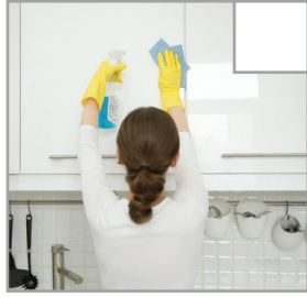
Schränktüren und Schubladen werden abgewischt.