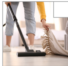
Saugen Sie den Boden einschließlich Teppichen (auch unter losen Teppichen).