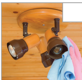
Wischen Sie Lampen mit einem trockenen Tuch ab.