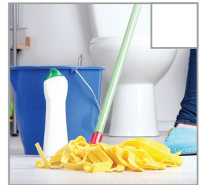
Boden wird gewischt.