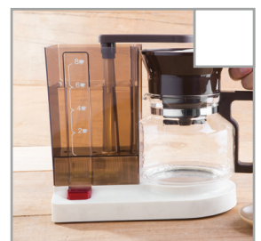
Entfernen Sie alle Filter und reinigen Sie die Kaffeemaschine/den Wasserkocher. Leeren und spülen Sie Thermoskannen.