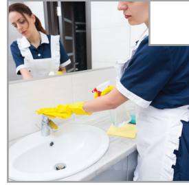
Waschbecken und Wasserhahn werden gereinigt.