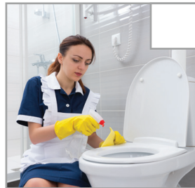
Toilette innen und außen reinigen.