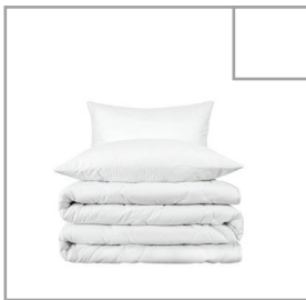
Bett staubsaugen. Kissen und Bettdecken ordentlich auf jedem Bett arrangieren.