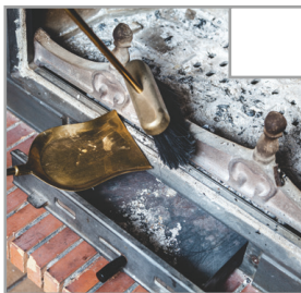
Kamin wird geleert und gereinigt. Asche niemals in den Mülleimer werfen, da Brandgefahr besteht.