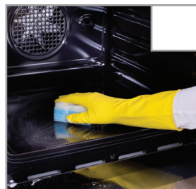
Ofentür wird mit einem Scheuerschwamm von Fett befreit.