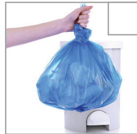
Abfalleimer im Bad wird geleert.