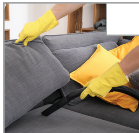
Stühle und Sofas werden gründlich gesaugt, auch unter den Kissen.