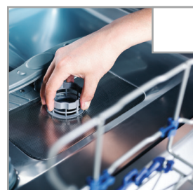
Leeren Sie den Filter im Geschirrspüler.