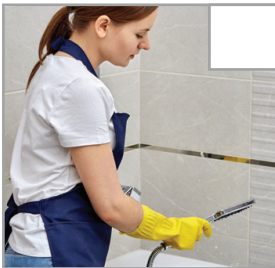
Bitte lassen Sie das letzte Badewasser im Whirlpool oder füllen Sie den Whirlpool mit sauberem Wasser über die Düsen, damit unser Personal den Whirlpool desinfizieren und reinigen kann.