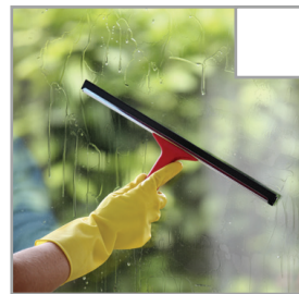
Fenster werden von Fettflecken gereinigt.