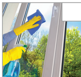
Fenster und Terrassentüren werden von Fettflecken gereinigt.