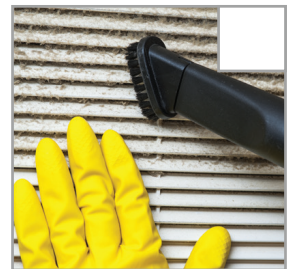
Spinnweben werden entfernt. Achten Sie darauf, dass Sie alle Ecken erreichen.